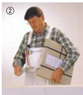
▲ Du trækker bare båndet ud af kassen...