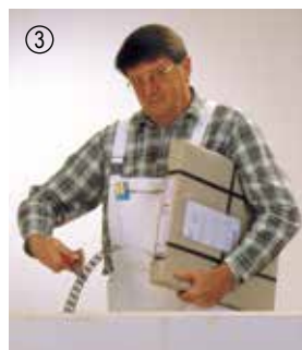
▲ ... klipper det af med en pladesaks...