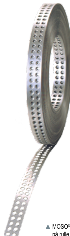
▲ MOSO® hulbånd på rulle

En anden foretrukken anvendelse er konstruktionsmæssig, permanent sikring mod grimme, synlige revner, hjælp til at holde garantikravene så små som muligt og sidst, men ikke mindst, at lette murerens daglige arbejde.