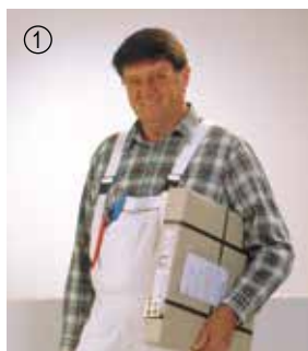
▲ Nem transport på byggepladsen