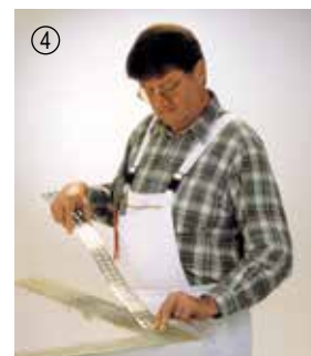
▲ ... og trykker det ned i mørtlen. Og det var det!