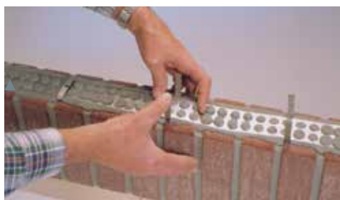
▲ ... og når standerskiftet er færdigt, lægges MOSO® hulbåndet på mellem bøjlerne. Derefter bukes hulbåndsbøjlerne blot ned. Og det var det.

... m overliggerstøtte med MOSO® hulbånd type 50 E 420 til fri spændvidde ... m, facadestensformat ..., overliggerhøjde ... cm, inklusive afbinding leveres og monteres fagligt korrekt