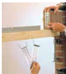
▲ ... sættes på murstenen under opmuringen...